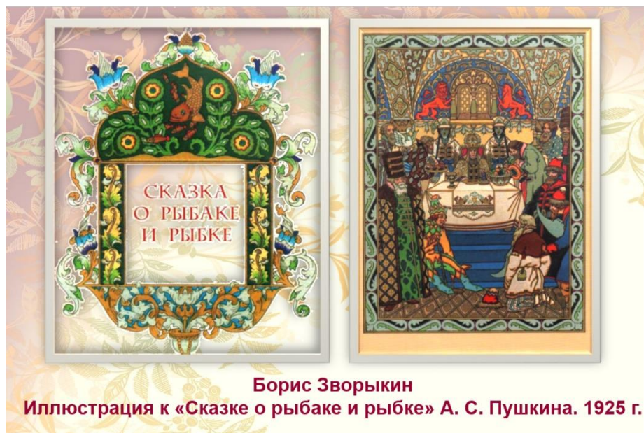
Иллюстрация к «Сказке о рыбаке и рыбке» А. С. Пушкина. 1925 г.