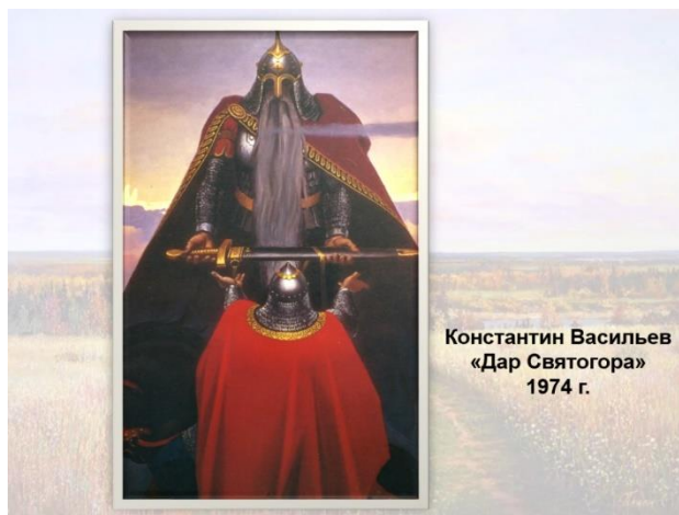
Иллюстрация художника к сказке, рассказу и т.д.:

Константин Васильев «Дар Святогора» 1974 г.