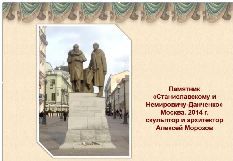
Памятник «Станиславскому и Немировичу-Данченко» Москва. 2014 г. скульптор и архитектор Алексей Морозов